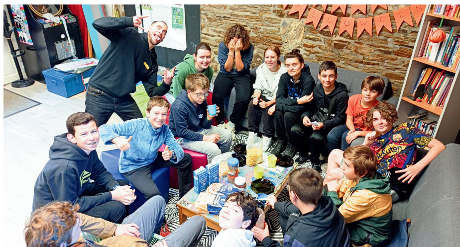
GOÛTER D'HALLOWEEN - OCTOBRE 2024