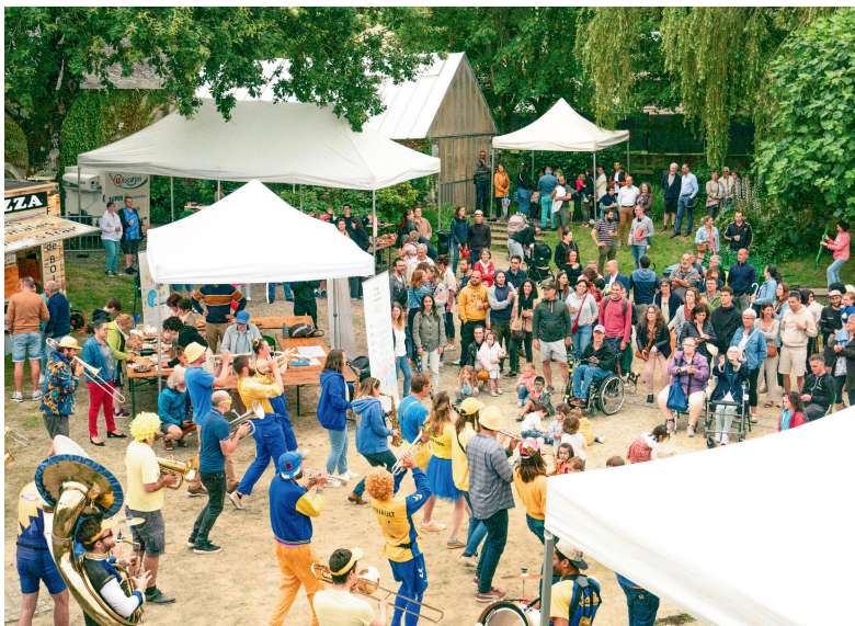
FÊTE DE QUARTIER 2024

C'est avec enthousiasme que le Centre Socioculturel annonce le lancement d'un projet qui va rassembler au-delà de La Bugallière. En effet, la traditionnelle fête de quartier se tiendra le 27 septembre 2025 dans le bourg de la commune d'Orvault et sera coordonnée par La FabRic, le nouvel Espace de Vie Sociale, qui occupe les locaux de l'ancienne école maternelle (29 Ter rue Robert Le Ricolais ).