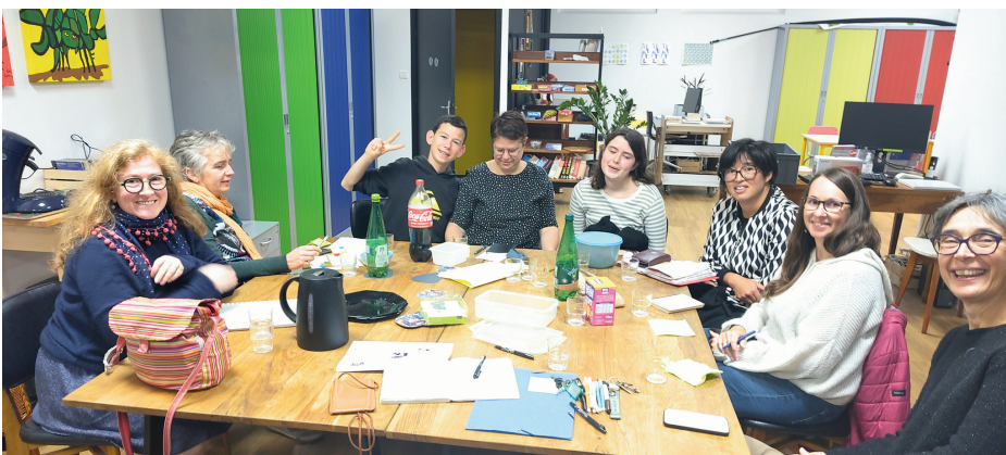
LA DERNIÈRE COMMISSION JEUNESSE DU 22 OCTOBRE 2024

Pour plus d'informations, contacter Estelle - Référente jeunesse 02 40 63 44 45