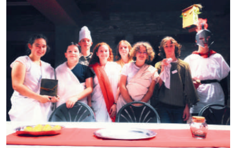
RETOUR SUR LA SOIRÉE 2023 MURDER PARTY CRIME EN ANTIQUITÉ

En famille, en solo ou entre amis, la soirée est gratuite, inscription dès maintenant à l'accueil ou au 02 40 63 44 45.