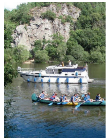
CANOË À L'ILE AUX PIES