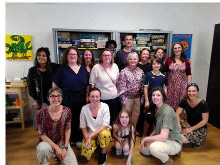
LES ÉQUIPES TULITUJOU ET LUDO PETITS JUN 2024

Vendredi 7 juin, c'était l'apéro ludo : une occasion de réunir les équipes bénévoles de Tulitujou et de la ludo petits et d'accueillir de nouvelles recrues !