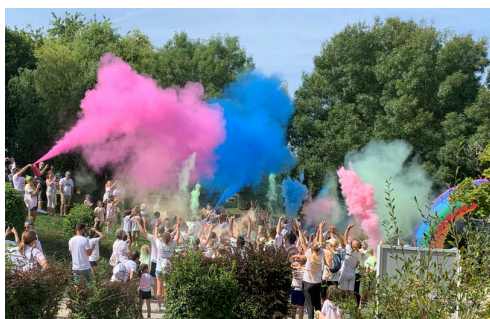
COLOR RUN ÉDITION 2023

Dans le quartier de la Bugallière, le dimanche 8 septembre 2024.