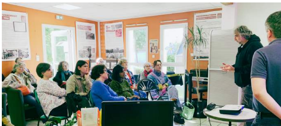
DÉVERNISSAGE EXPO " GENS DU VOYAGE "

Nous avons été une vingtaine de personnes présentes sur ce moment riche, pour déconstruire nos préjugés.