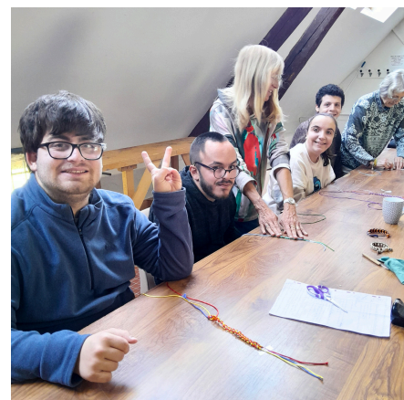
ANIMATION MACRAMÉ AVEC LES JEUNES DE L'ADAPEI

Ils sont restés très concentrés durant tout le processus de création. Quel plaisir et fierté pour ces jeunes de voir le résultat et de porter ces bracelets à leur poignet !