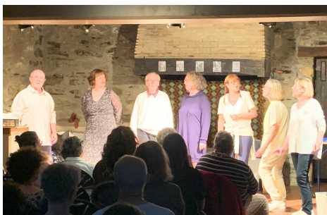
GRUPE VOCAL "LES IMPOSTEURS "

En effet, entre Bourvil, Zaho de Sagazan ou Jeanne Cherhal, c'est l'émotion que les interprètes ont mis dans chaque chanson, qui leur a redonné toute leur signification. La sincérité et parfois la fragilité de l'interprétation de certaines chansons ont donné à ce spectacle une sensibilité que le public (salle comble!) a semblé apprécier.