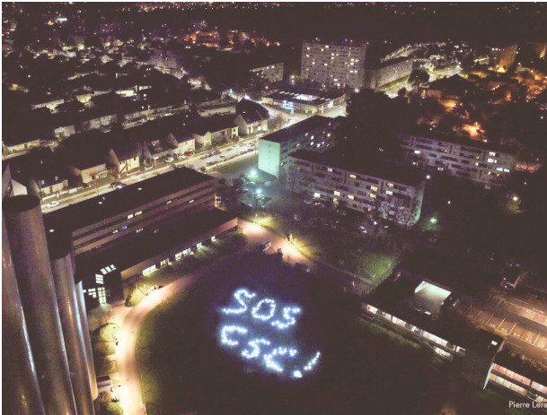
PHOTO PRISE DU 27ÈME ÉTAGE DU SILLON DE BRETAGNE SOS LANCÉ PAR LES CSC DE LOIRE-ATLANTIQUE, MERCREDI SOIR 31 JANVIER

C'est lors de cette rencontre que la photo ci-jointe a été prise du 27ème étage du Sillon ; les lumières correspondant aux téléphones des participants.