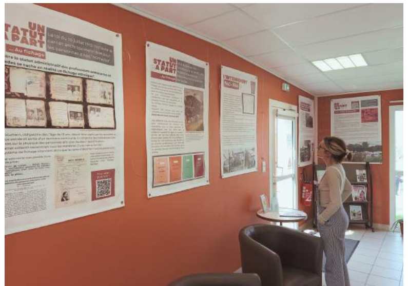
EXPOSITION - HISTOIRE DES FAMILLES ITINÉRANTES

Plus d'informations auprès de Mélanie ou d'Estelle au 02 40 63 44 45