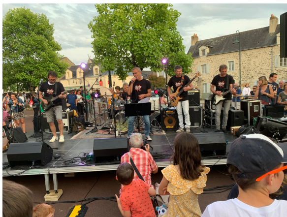
LES BURN OUT À LA FÊTE DE LA MUSIQUE JUN 2023

Le festival "Rock en Ferme" est l'illustration avec l'histoire de ce lieu (La ferme de la Bugallière) où se joue désormais plus de culture que d'agriculture mais dont le cœur respire la solidarité et le partage. Venez découvrir le premier Festival de Rock solidaire organisé par le Centre Socioculturel en partenariat avec "Origami" et avec le soutien la Ville d'Orvault.