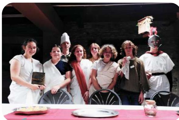
SOIRÉE MURDER "CRIME EN ANTIQUITÉ"