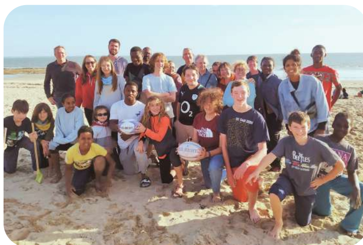
WEEK-END FAMILLES DANS LE MORBIHAN