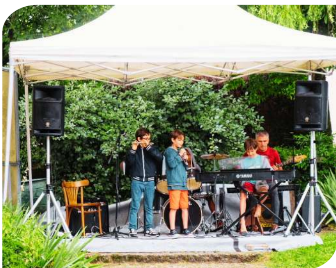
CONCERT DE FIN D'ANNÉE !