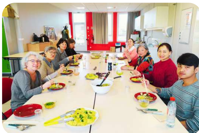
ATELIER CUISINE VIETNAMIENNE AVEC LIRE ECRIRE COMPTER