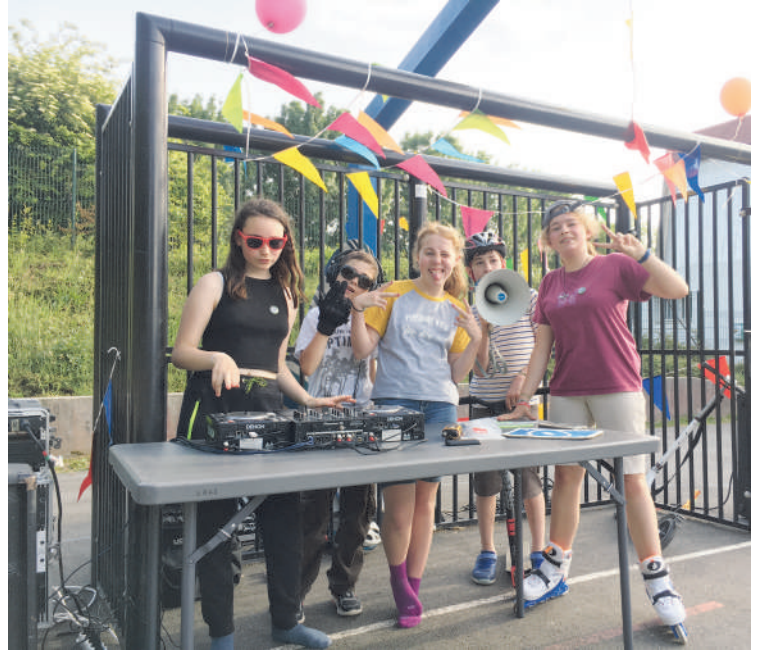
LES DJs LORS DE LA FÊTE DE QUARTIER 2022