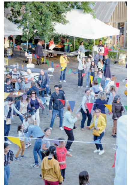
FÊTE DE QUARTIER 2022